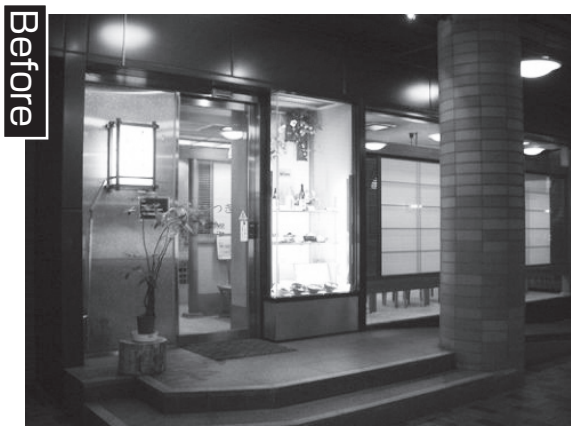
旧和食レストラン「さつき」

一般の発表の場は令和6年10月1日より、開始します(申し込みは7月1日より)。 令和6年4月1日～9月30日までは、メイシアター主催の様々なジャンルの催し物を予定しています。