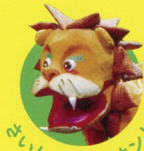
さいしょにライオン!