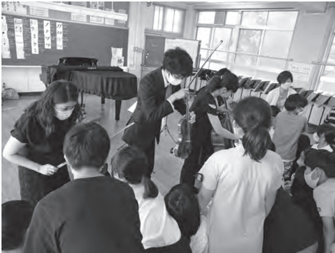
●小学校出張コンサート6/22 (吹田東小)