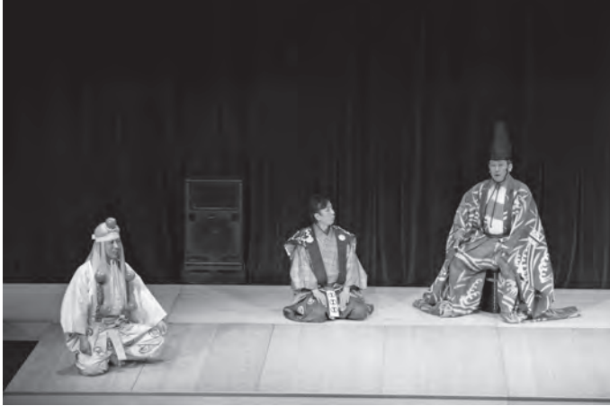
●Cutting Edge狂言2/4 (中ホール)