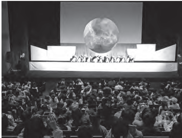
●人形劇団クラルテ1/4 (中ホール)