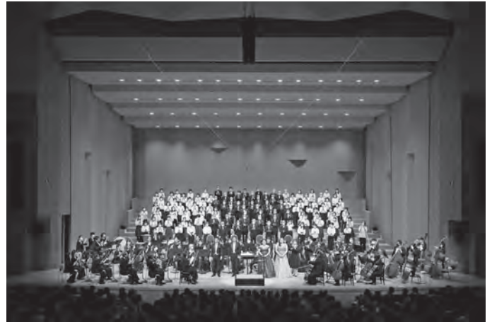
●吹田市民の第九12/25 (大ホール)