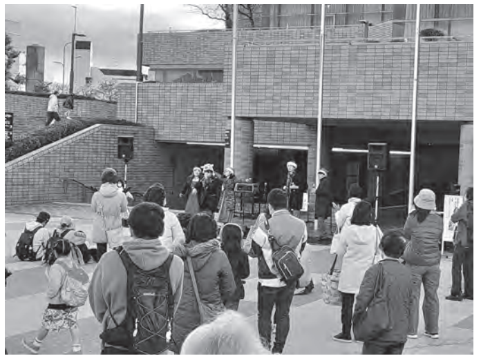
●チェレステFメルクルズ12/11 (いずみの園)