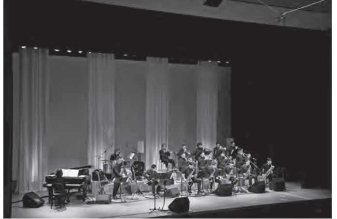
●ネイバーフッドビッグバンド2/25 (中ホール)