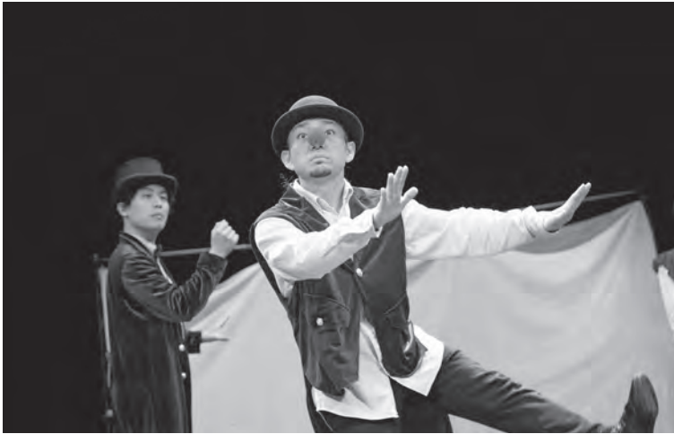
●いいむろなおきマイムカンパニー3/11 (中ホール)