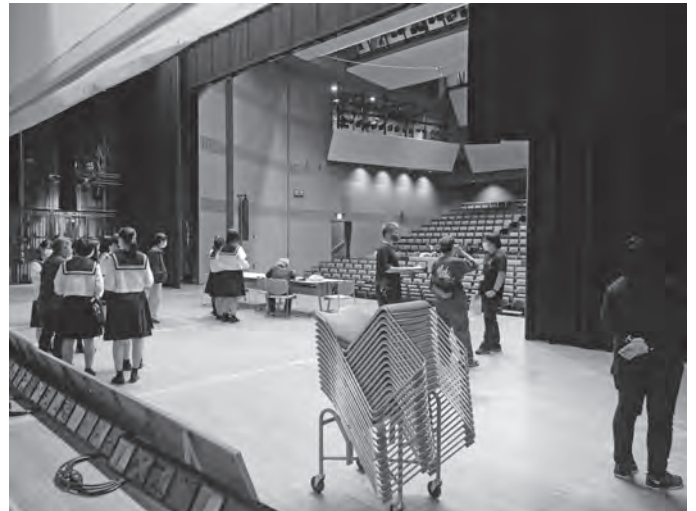
●HPF大阪高校演劇祭7/27 (中ホール)