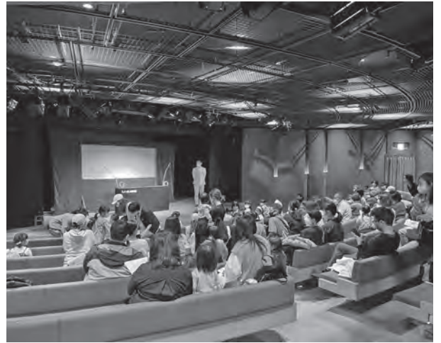
●人形劇団クラルテ3/27 (小ホール)