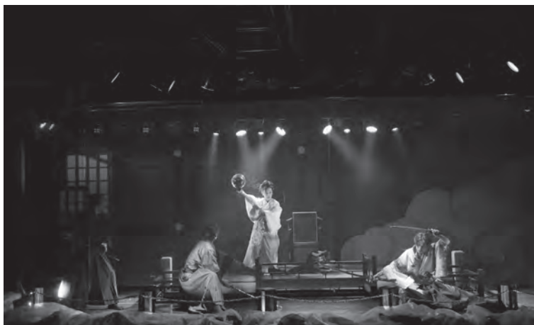
●SHOW劇場 天守物語1/26 (小ホール)