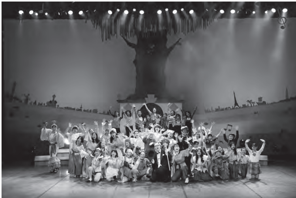
●ファミリーミュージカル3/18 (中ホール)