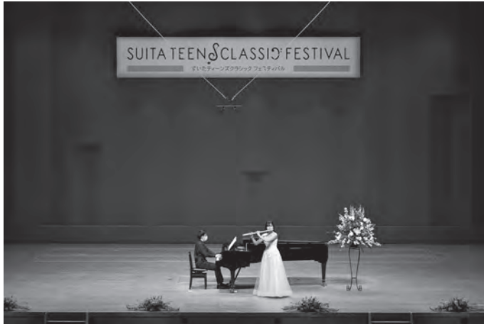
●ティーンズクラシックフェスティバル本選12/18 (大ホール)