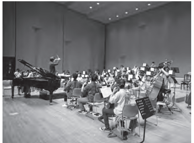
●大阪大学交響楽団9/10 (大ホール)