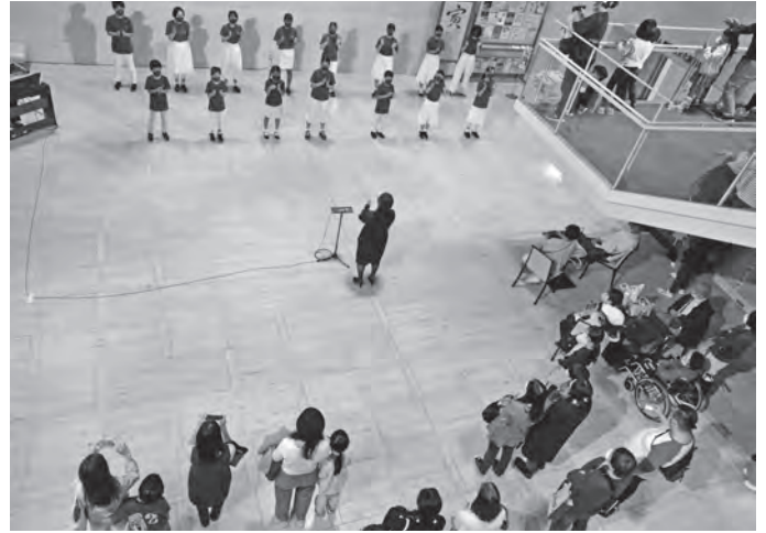
●メイシアター少年少女合唱団ロビーコンサート11/3