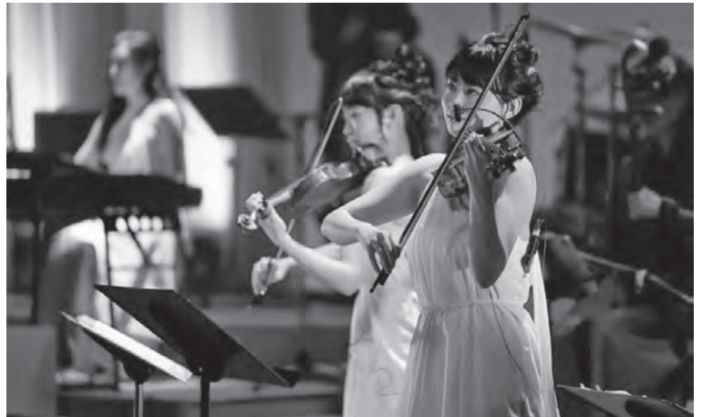
●ミュージックサーカス1/8 (中ホール)