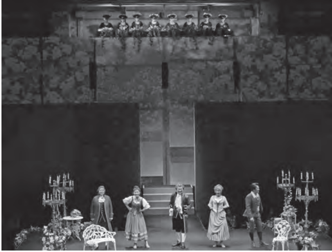
●関西歌劇団9/17 (中ホール)