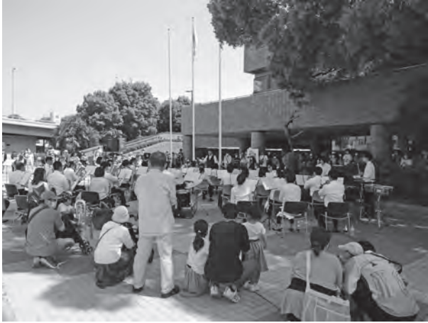
●メゾンウインドオーケストラ5/29 (いずみの園)