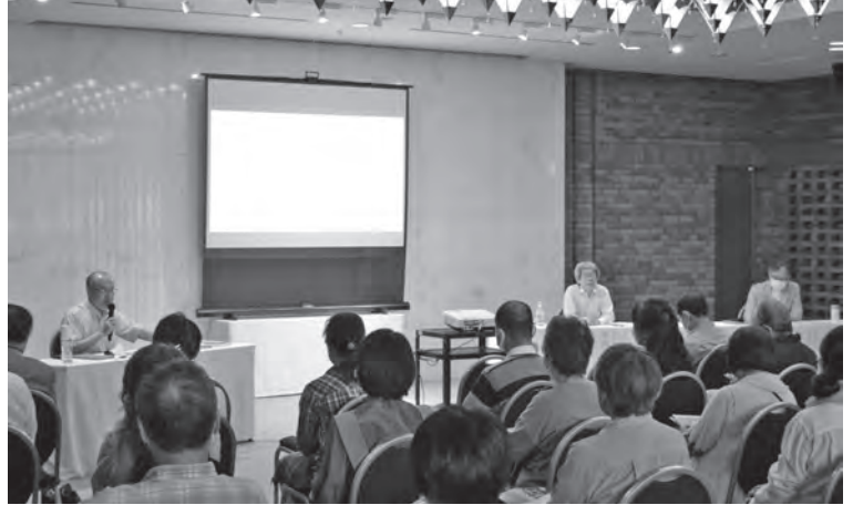
●文化政策ビジョンシンポジウム6/19 (レセプションホール)