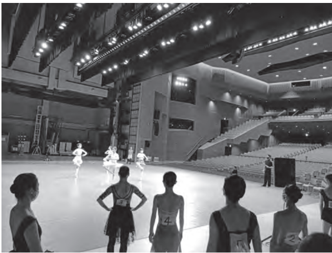
●バレエオーディション11/12 (大ホール)