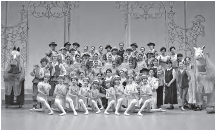
●東京バレエ団8/12 (大ホール)