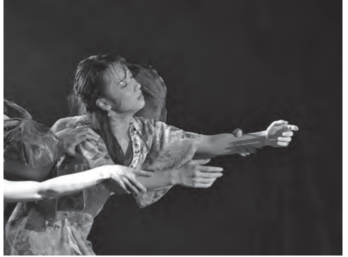
●DANCE PROJECT218. 9/24 (小ホール)