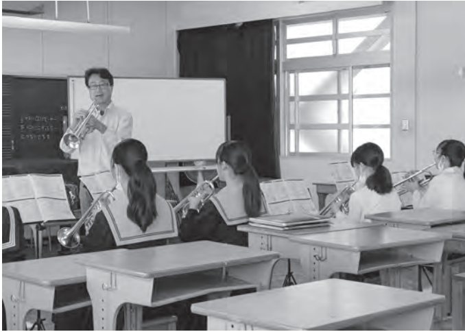
●ブラスクリニック10/15 (山田中)