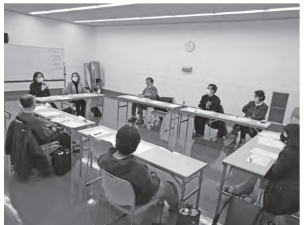
●劇評ワークショップ1/28 (第2練習室)