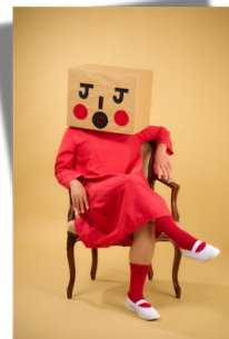
ポルトガル愛からの 『いろんな☆愛のカタチ』