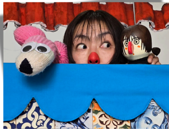
赤裸々ポルトガル生活 『リスボン・アティピカ ダイアリー』