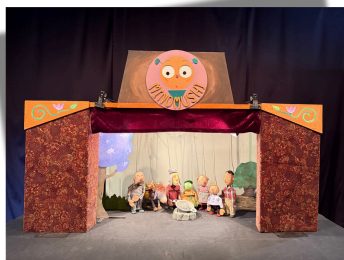
ポルトガル民話より 『石のスープ』