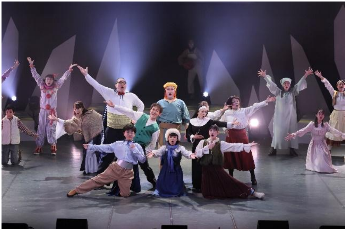
3/15 ファミリーミュージカル（中ホール）