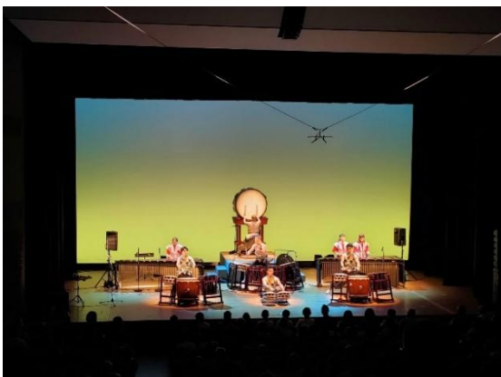
7/4 和太鼓松村組（中ホール）