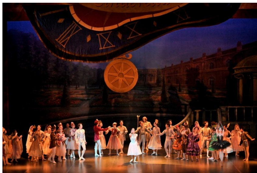
3/9 法村友井バレエ団（大ホール）