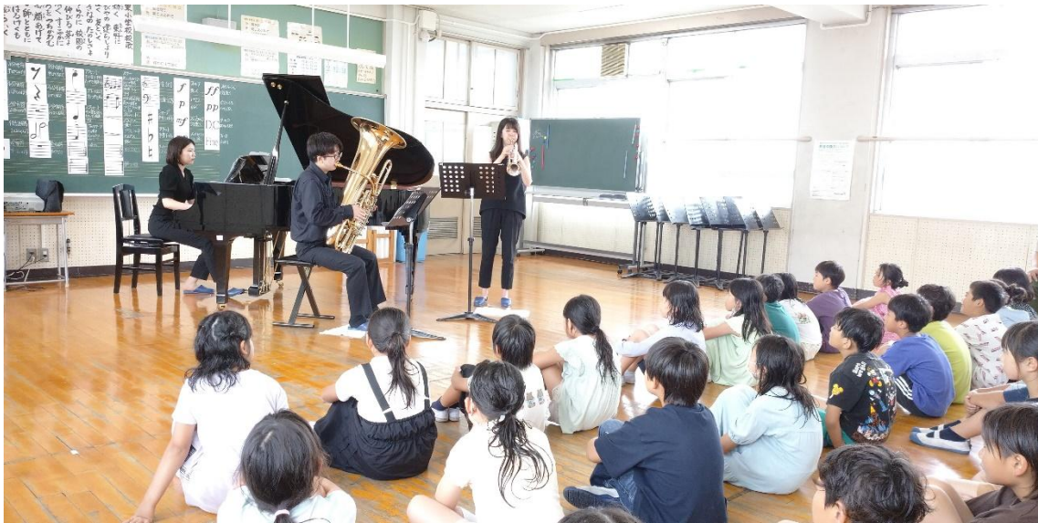
6/24 出張コンサート（小学校）