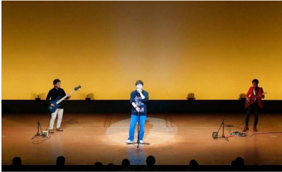
1/18 芸術芸能フェスティバル（中ホール）