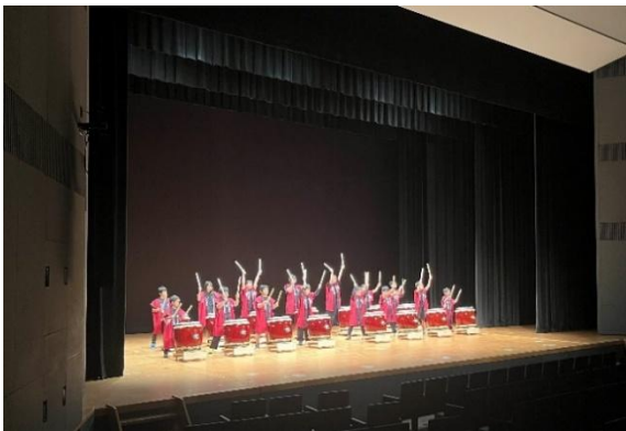
10/31 和太鼓ワークショップ（中ホール）