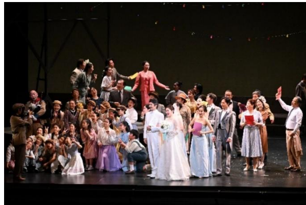
9/21 関西歌劇団オペラ（大ホール）