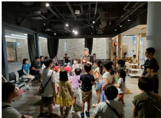
7/21 ピアノ解体ショー（SUITA×ART）