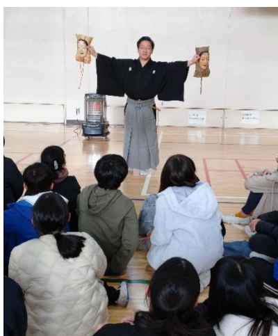
12/20 能ワークショップ（小学校）