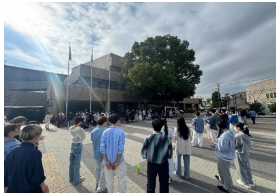
11/17 大学公園ライブ（いずみの園公園）