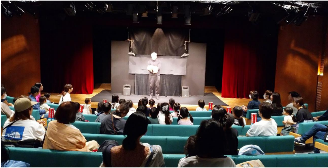
7/30 人形劇はじまるよー！（小ホール）