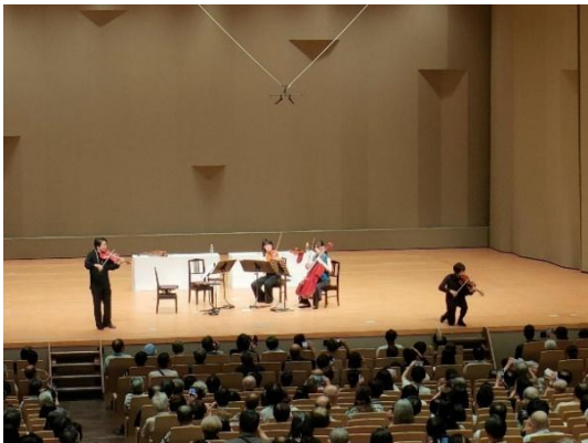
9/8 弦楽四重奏 based on Suite（大ホール）