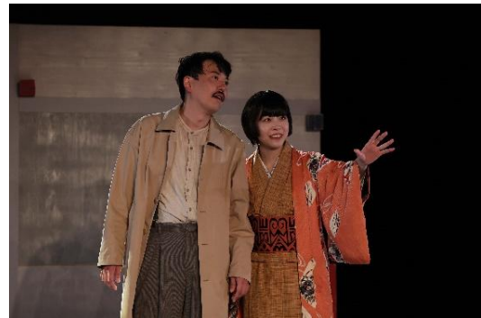
2/8 SHOW 劇場「a 次元のふたり」（小ホール）