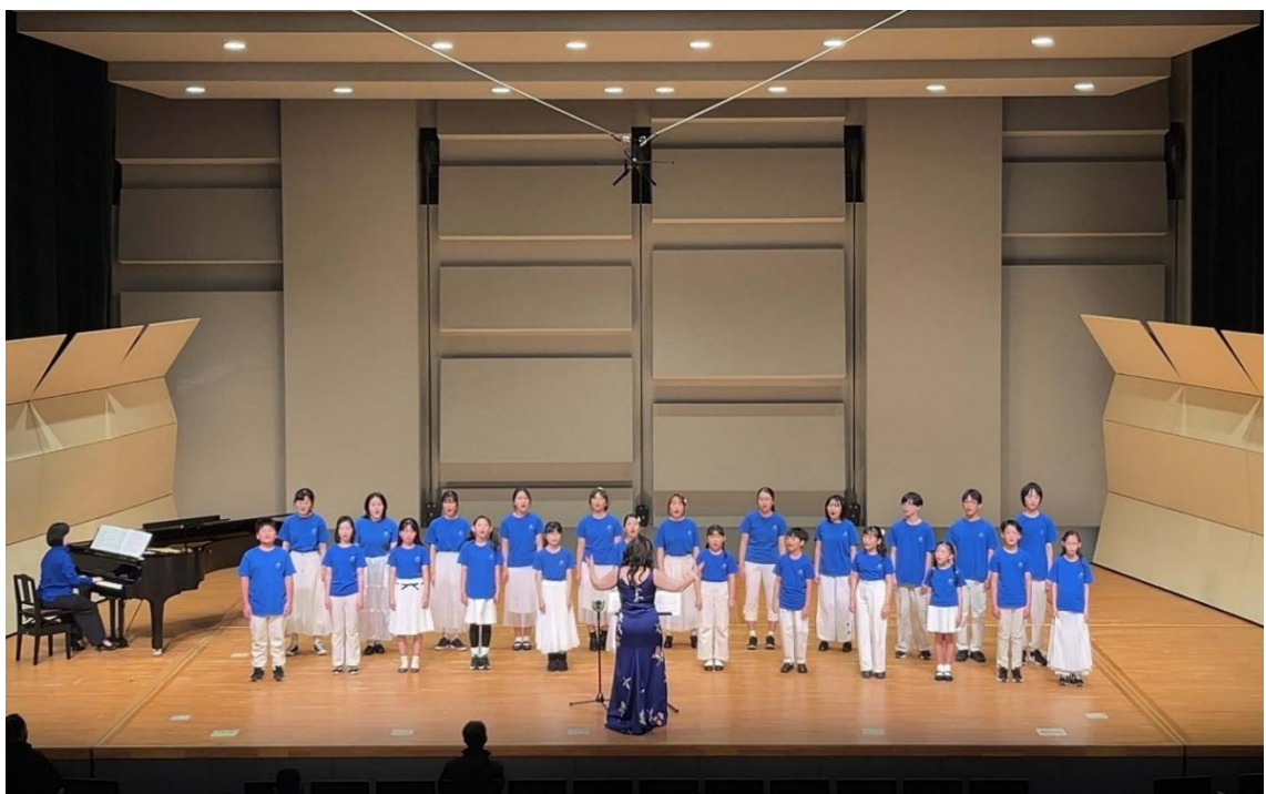
少年少女合唱団（中ホール）