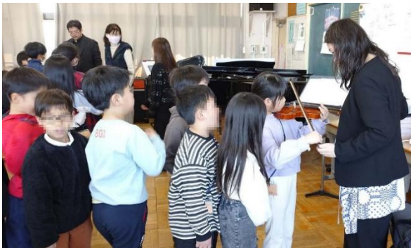
1/28 出張コンサート楽器体験（小学校）