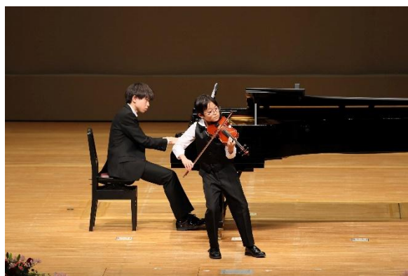
12/15 ティーンズクラシックフェス本選（大ホール）