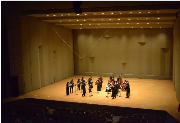
4/7 スーパークラシックアンサンブル（大ホール）