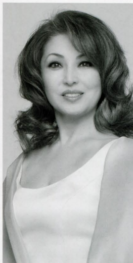
佐藤しのぶ Shinobu Sato [ソプラノ:Soprano]