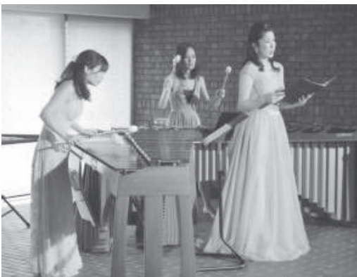
■名曲日和 10/7 (彫刻の美術館 スキュルチュール江坂)