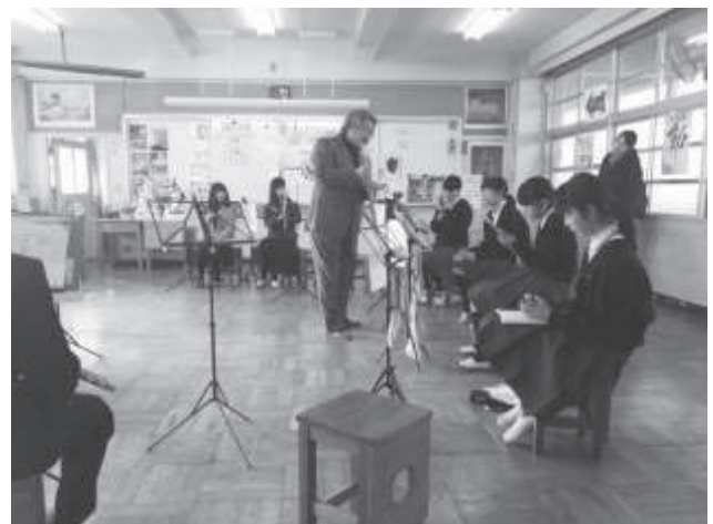
■プラスレッスン事業 1/20 (吹田市立古江台中学校)