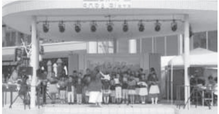
■メイシアター少年少女合唱団 練習 通年 (千里山コミュニティセンター)、出演 7/8 (エキスポシティ)