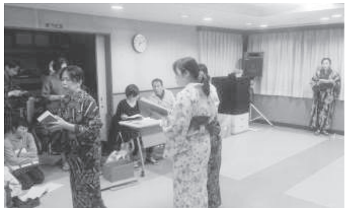
■カレーと村民 練習 1/6-3/16 (浜屋敷、岸部市民センター)