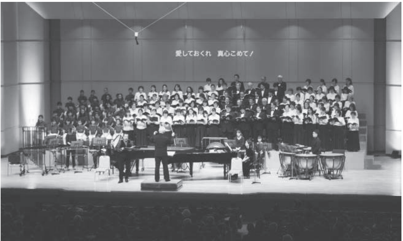
■カルミナ・ブラーナ 12/17 (千里金蘭大学佐藤記念講堂)