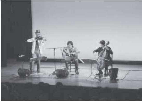
■ワールドミュージックシリーズ 6/10 (千里市民センター)