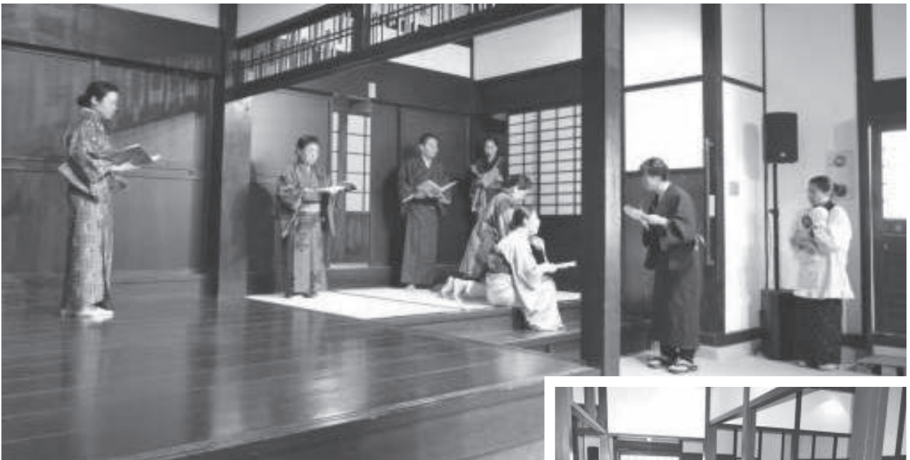
■カレーと村民 公演 3/17 (浜屋敷)