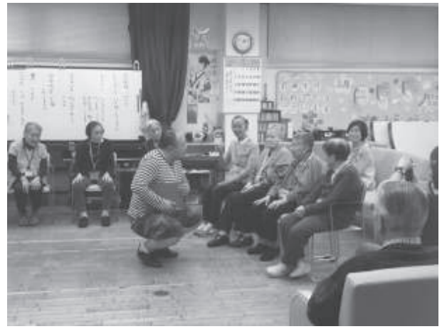
■演劇ワークショップ 1/25-3/21 (吹田市立山田第三小学校、内本町デイサービスセンター)