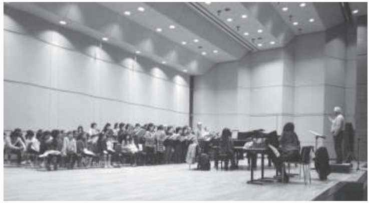
■カルミナ・ブラーナ合唱練習 7/16-12/16 (豊一市民センター、千里金蘭大学佐藤記念講堂)